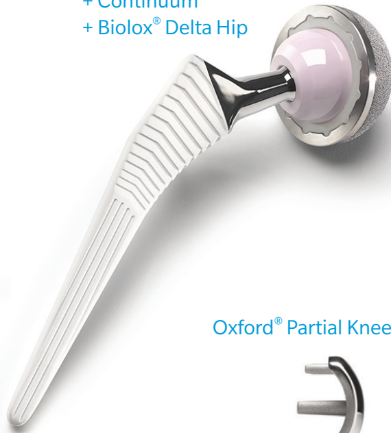
Oxford® Partial Knee